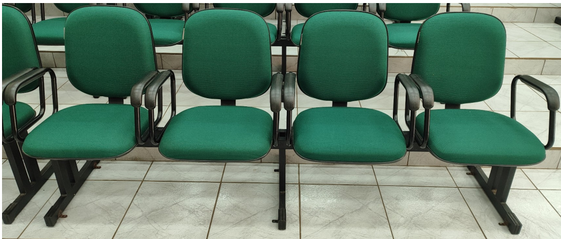
Longarinas do público.

As poltronas a serem reformadas e os tecidos escolhidos para a substituição são mostrados nas figuras a seguir.