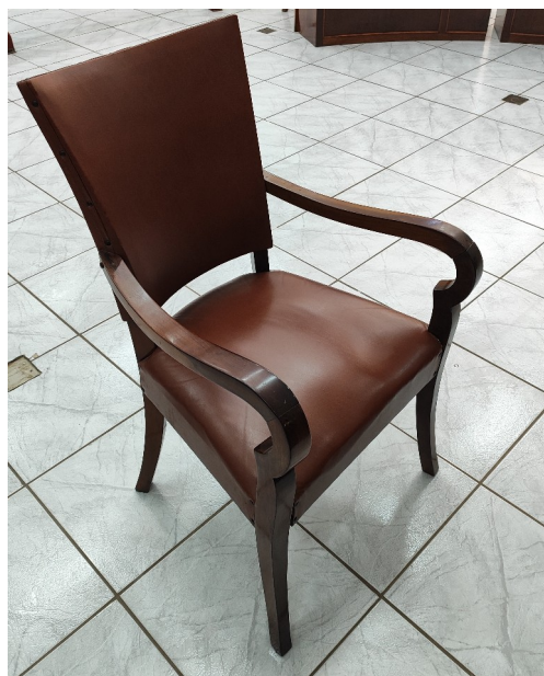
Poltrona dos vereadores.