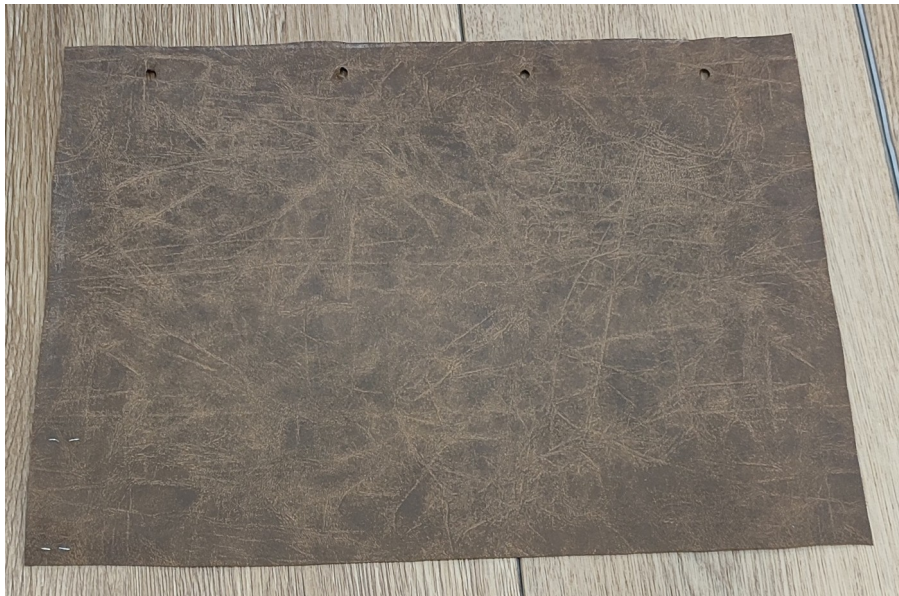
Tecido escolhido para substituição do tecido das poltronas dos vereadores.